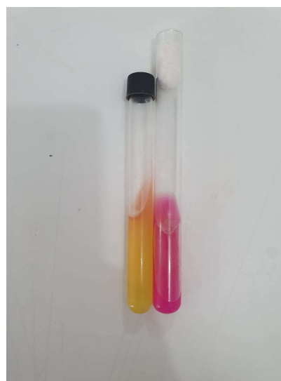
Figura 2: Prova da uréase demonstrando resultados negativos (estrutura esquerda) e positivos (estrutura direita) para C. neoformans .

Por possuir morfologia muito similares entre si, as leveduras patogênicas se tornam mais difíceis de diferenciar através das técnicas de coloração convencionais. No entanto o C. neoformans promove a formação de uma cápsula polissacarídica que reveste toda a estrutura do microrganismo, um fator de virulência considerável tendo em vista o potencial patogênico dessa espécie. Para a visualização adequada desta estrutura, é necessário a utilização da tinta nanquim para uma melhor evidência do microrganismo. É