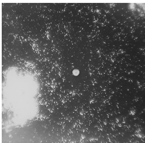
Figura 1: Presença da cápsula polissacarídica em amostra corada com tinta nanquim, aumentativo de 40x.

Dentre as amostras selecionadas para compor este estudo 75% (6/8) apresentaram presença de leveduras revestidas com cápsulas polissacarídicas (Figura 1). Para a confirmação da levedura patogênica foi realizado o teste de produção da uréase. A diferença de coloração do meio de cultura que permite a diferenciação de amostras positivas e negativas pode ser observado na figura 2.